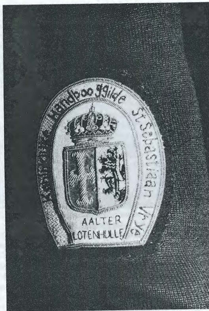
Het tegenwoordige schild van de Sint-Sebastiaangilde.