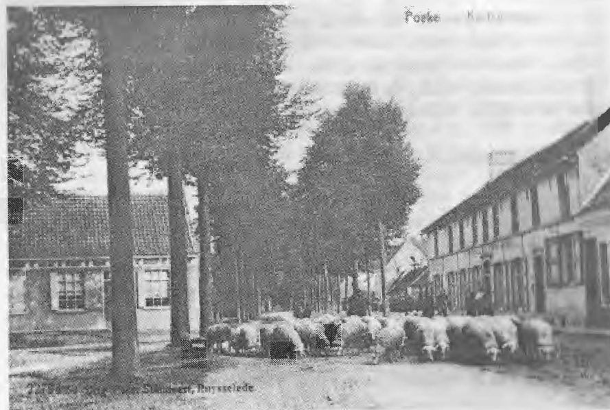
"Poekeplaats" met rechts op de foto de herberg "Het Gemeentehuis". Deze herberg was het gildehuis van de handboogschutters.